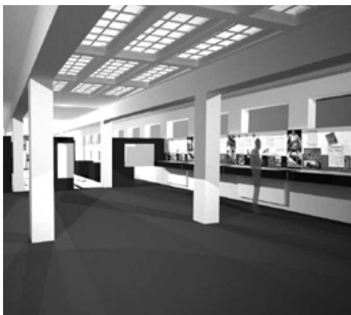
Architektenentwurf für das „Rote Wien“-Museum

W ien besitzt eine Vielzahl kleiner und sehr spezieller Museen – vom Bestattungsmuseum bis zum Rauchfangkehrermuseum. Über die Zeit der Ersten Republik und des „Roten Wien“, welche die Stadt und ihr Erscheinungsbild geprägt haben wie kaum eine andere Periode, gab es bis dato kaum etwas zu besichtigen – abgesehen natürlich von zahlreichen Bauwerken. Wurden doch alleine während der Ersten Republik über 380 kommunale Wohnbauten errichtet. Im wohl berühmtesten dieser „Gemeindebauten“, dem einen Kilometer langen Karl-Marx-Hof, wird ab Ende April 2010 eine Dauerausstellung über das „Rote Wien“ diese Lücke schließen.