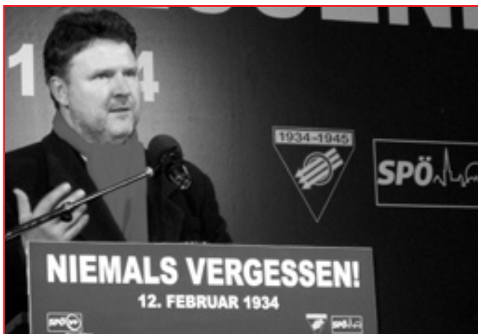
Vizebürgermeister Dr. Michael Ludwig bei der Gedenkrede