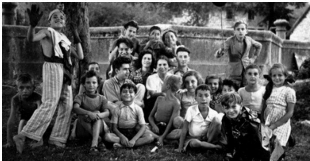
So fröhlich spielten die jüdischen Kinder noch Theater im Maison d'Izieu