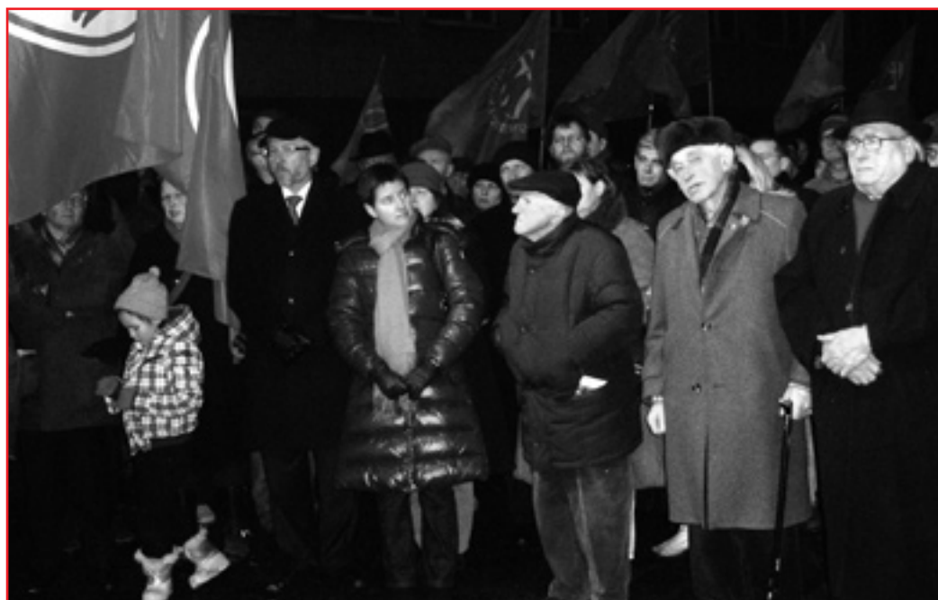
Bei grimmiger Kälte gedachten hunderte Genossinnen und Genossen des 12. Februar 1934

In vielen Wiener Bezirken fanden bei den örtlichen Gedenkstätten für die Februarkämpfer Kranzniederlegungen statt. ■