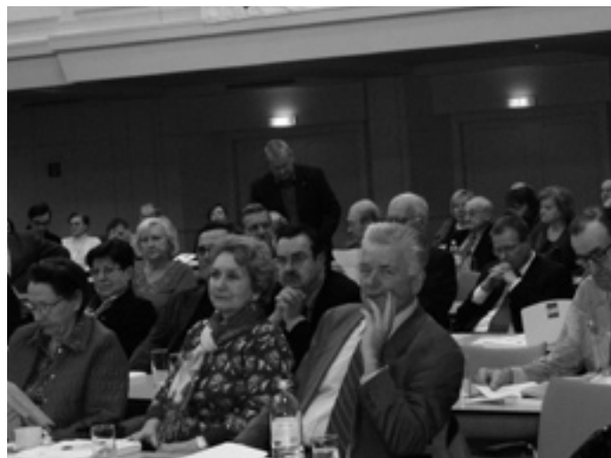
Delegierte der Wiener Landeskonferenz