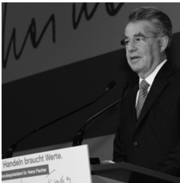
Bundespräsident Heinz Fischer: „Politik braucht Werte.“

Vor den Abgeordneten sagte er dazu: „Ich kann und werde meine Herkunft aus der österreichischen Sozialdemokratie nicht verleugnen und den Idealen meiner Jugend nicht untreu werden, aber ich kann und werde jede Parteilichkeit hinter mir lassen, meine Befugnisse nach bestem Wissen und Gewissen ausüben und der Bundesprä-