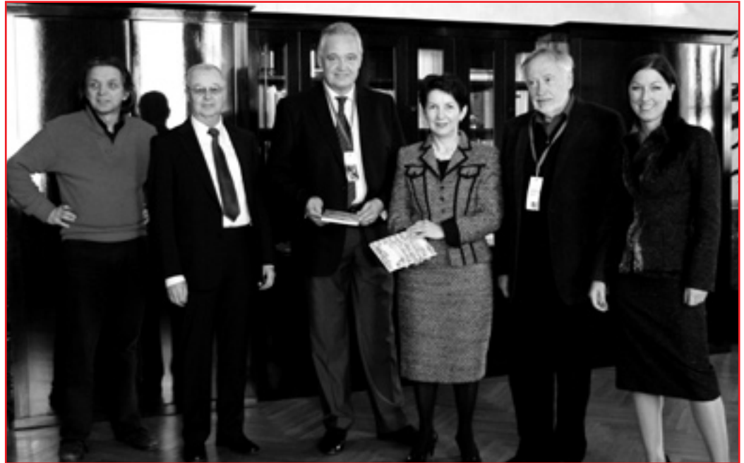
Nationalratspräsidentin Barbara Prammer schrieb das Vorwort im Konzeptbuch der Architekten in deutscher und slowenischer Sprache

Vorrangiges Ziel der Erneuerung ist, die Namen der Opfer dort zu verewigen. Ein Denkmal, das die Namen der Opfer dem Vergessen zu entreißen vermag, macht den Menschen in seinem geschichtlichen Wesen wieder kenntlich. Es geht